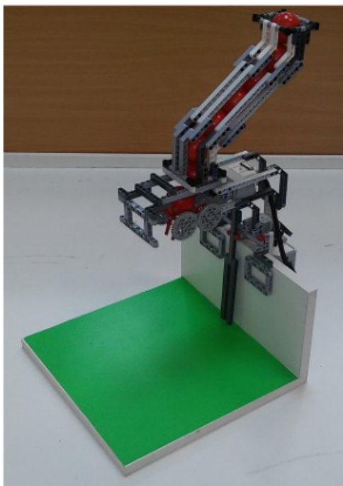
Рис. 2. Внешний вид устройства выдачи шариков

2.7. Шарик падает из устройства выдачи шариков с высоты 200 мм в течении 0,5 с после нажатия кнопки на расстоянии 135 мм от стенки области получения шариков.